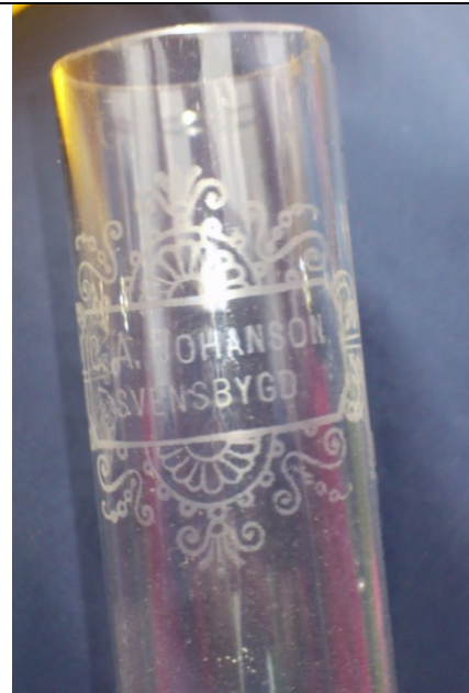
Brännarör till fotogenlampa med text.

SPECERI- & DIVERSEAFFÄR Telefon: Långöby 13