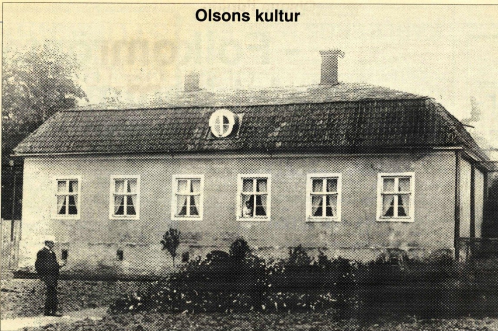
Nydala herrgård i början av seklet.