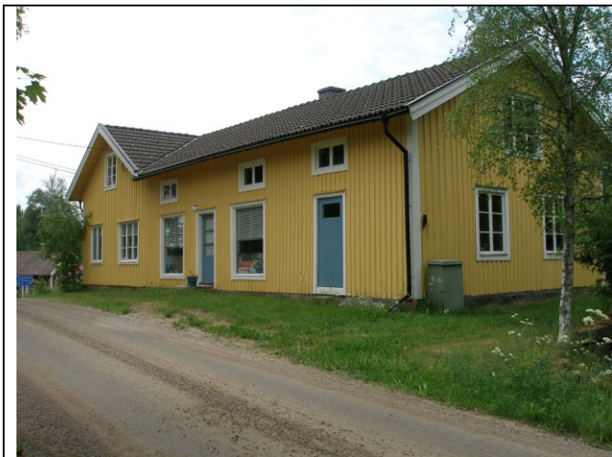
Affärsdelen flyttades 1901 från Moboda. Foto 2012.