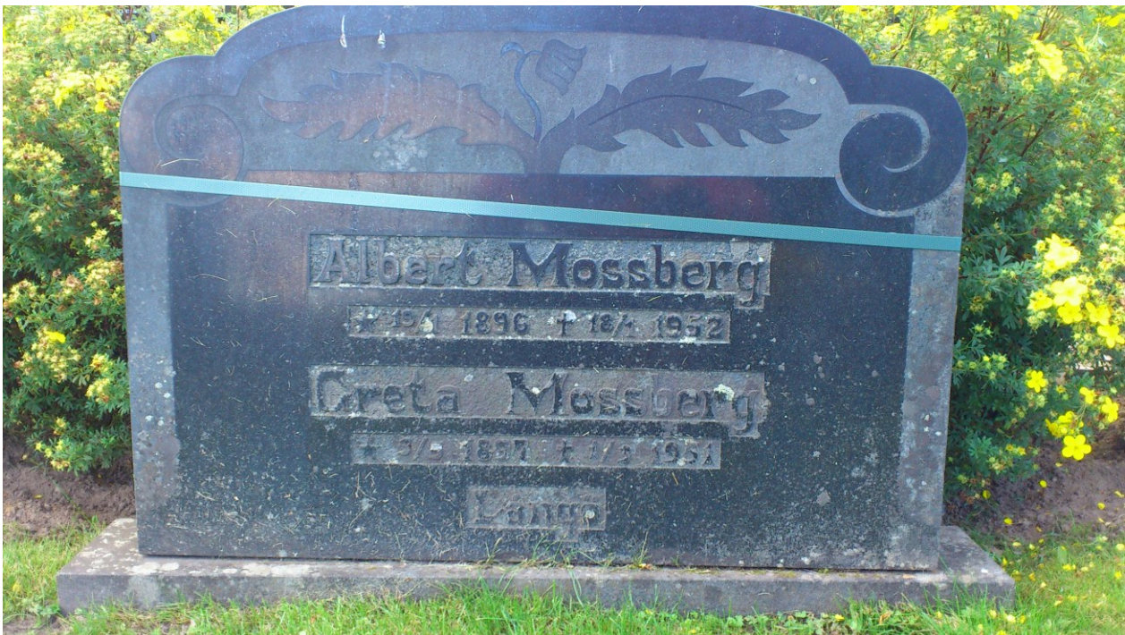
Nydala Kyrkogård. Foto 2017