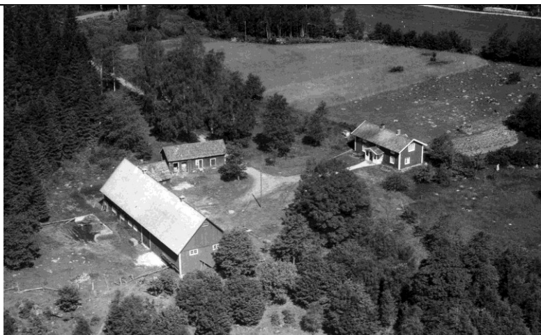
Svenska Gods och Gårdar. 1941