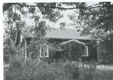
Staveryd 1, Nyäng, Stockaryd: 1.300 kvm. Förvärvat 1901. Trä, 1901, 3 rum, 1 kök, 1 hall. El, v, avl. Äg. fast.äg. Hanna Nygren; barq: Erik.