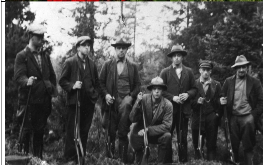
Jaktlaget i Sköldsbo 1928. (Bilder från Nydala)