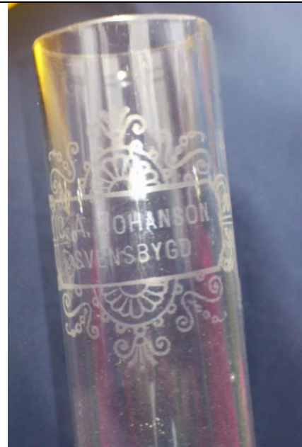
Brännarör till fotogenlampa med text.

SPECIAL- & DIVERSEAFFÄR Telefon: Långöby 13