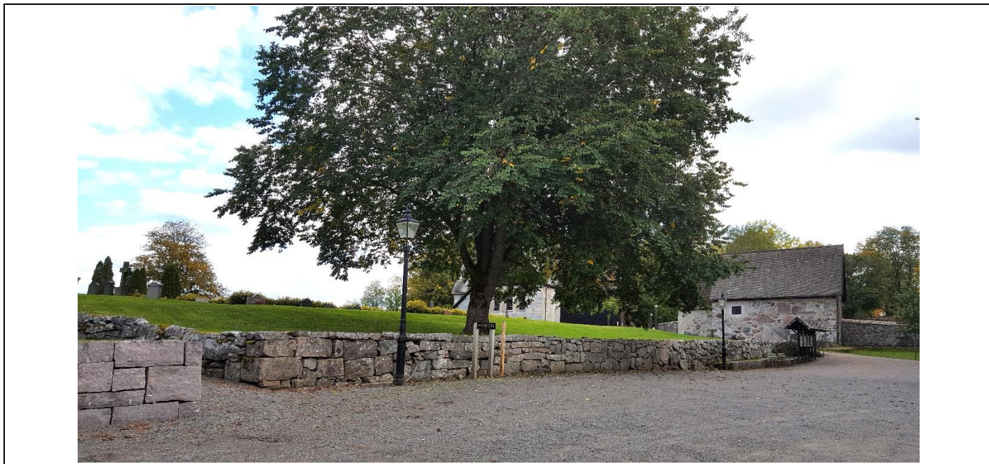
På denna plats låg Sockenstugan/skolan fram till 1945, se nedan.