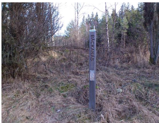
Maj 2010: Platsen är markerad.

Hänvisning till Folk och Fornt i Nydala socken, av Henry Renshult