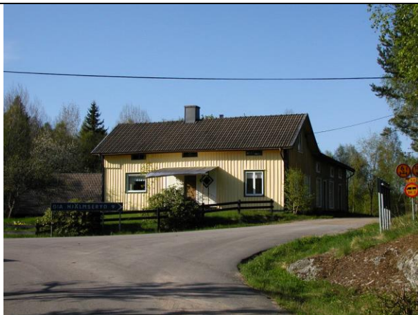
Bostadshuset på Bäckanäs flyttades 1909 till Långö och blev bostadsdel till lanthandeln

Hänvisning till Folk och Fornt i Nydala socken, av Henry Renshult