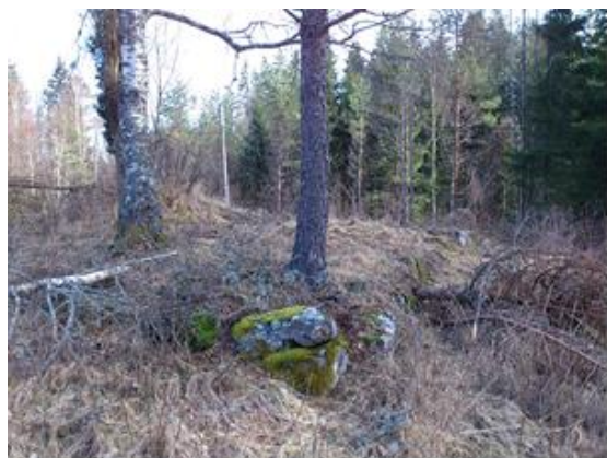
Maj 2010: Grunden är det som är synligt.