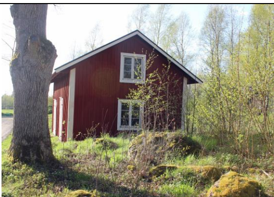
Huset på Långö 3:4. Foto 2015.

Flyttades till Långö 3:4 1931 och blev tvättstuga.